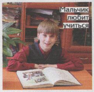
Мальчик любит учиться

– У меня было классное лето, – рассказывает мальчик «СтарХиту». – Мы с ребятами ездили в лагерь, за город. Я собрал футбольную команду, играли против мальчишек постарше. И, между прочим, часто побеждали, я забивал в каждом матче! Вечерами пели у костра, рассказывали истории. Мне очень в лагере понравилось. Но я соскучился по школе, рад, что начались занятия, я ведь уже взрослый, надо учиться дальше. Самый любимый урок, конечно же, физкультура. Еще нравятся математика и природоведение. Нам столько всего интересного рассказывают про зверей, птиц и растения! Жду, когда начнет география, вот это будет здорово – читать про другие страны и путешествия... Только с русским языком у меня пока не получается. Но буду стараться!